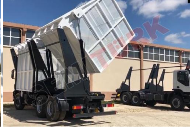
Kamyon şasisi üzeri uygulama - “Silaj Hasadı İçin Yüksek Yana Devrilir Araç Üstü Damper”