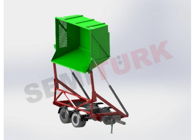
Römork şasisi üzeri uygulama - “Şeker Kamışı Damperli Yana Devrilir Römork”