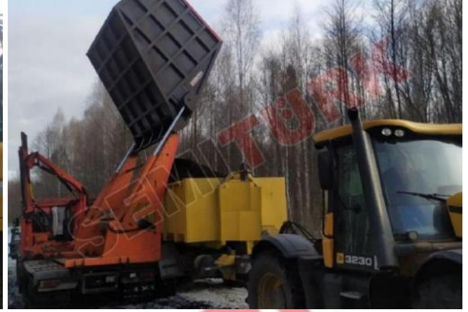
Paletli araç şasisi üzeri uygulama - “Yana Devrilir Yüksek Damperli Taşıma Kovaları”